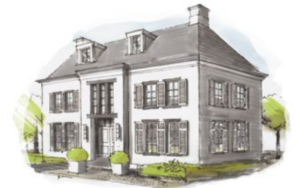
Ontwerp Villa Almere