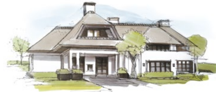
Ontwerp Villa Blaricum