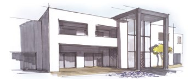
Ontwerp Villa Paramaribo