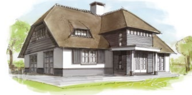
Ontwerp Villa Laren