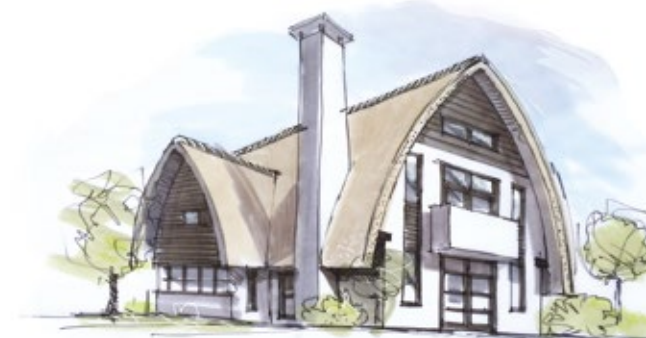
Ontwerp Villa Zutphen