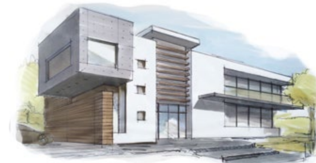
Ontwerp Villa School