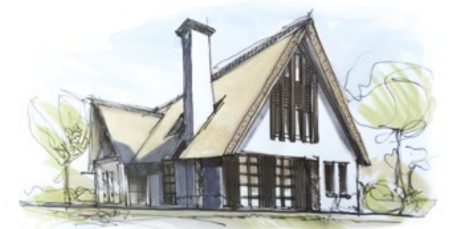
Ontwerp Villa Zeist