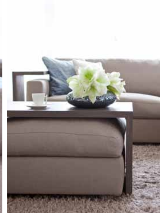
In de woonkamer staan een hoekbank en loveseat van Linteloo, type Fabio. De salontafel is meubelmaatwerk van Designa. Het fraaie tapijt is van Limited Edition.