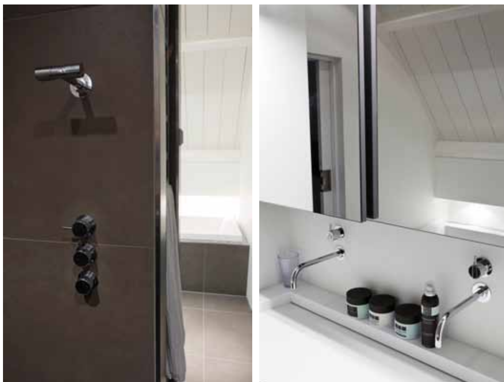
Badombouw en douchevloer kregen dezelfde tegels. Ook hier is er oog voor detail.

voorkomen werd besloten de verlichting via domotica te bedienen. Geen ingewikkeld gedoe, maar een handige omgevingsbesturing die de kwaliteit en het comfort van de woning verbetert. Met één druk op de knop zorgt het systeem – eveneens instelbaar via laptop of computer – voor het aan- en uitdoen van het licht en de open haard, het openen en sluiten van gordijnen of de juiste klimaatbeheersing.