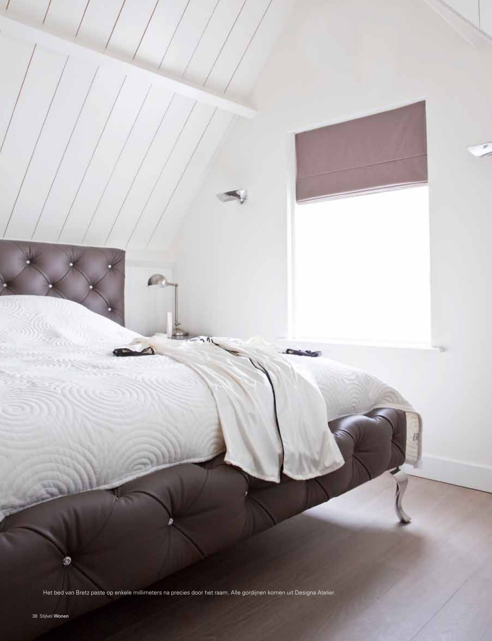
Het bed van Bretz paste op enkele millimeters na precies door het raam. Alle gordijnen komen uit Designa Atelier.