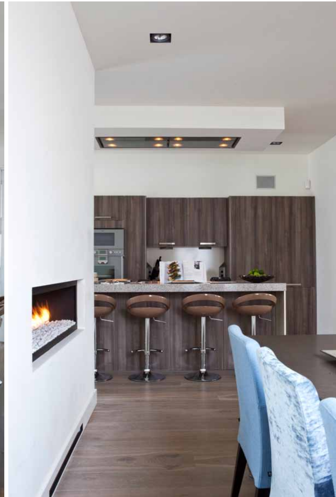
De keuken is van de Tweede Kamer en bestaat uit houtdecor en hoogglans spuitwerk. De leverkleurige krukjes bij het eiland worden door Designa geïmporteerd.